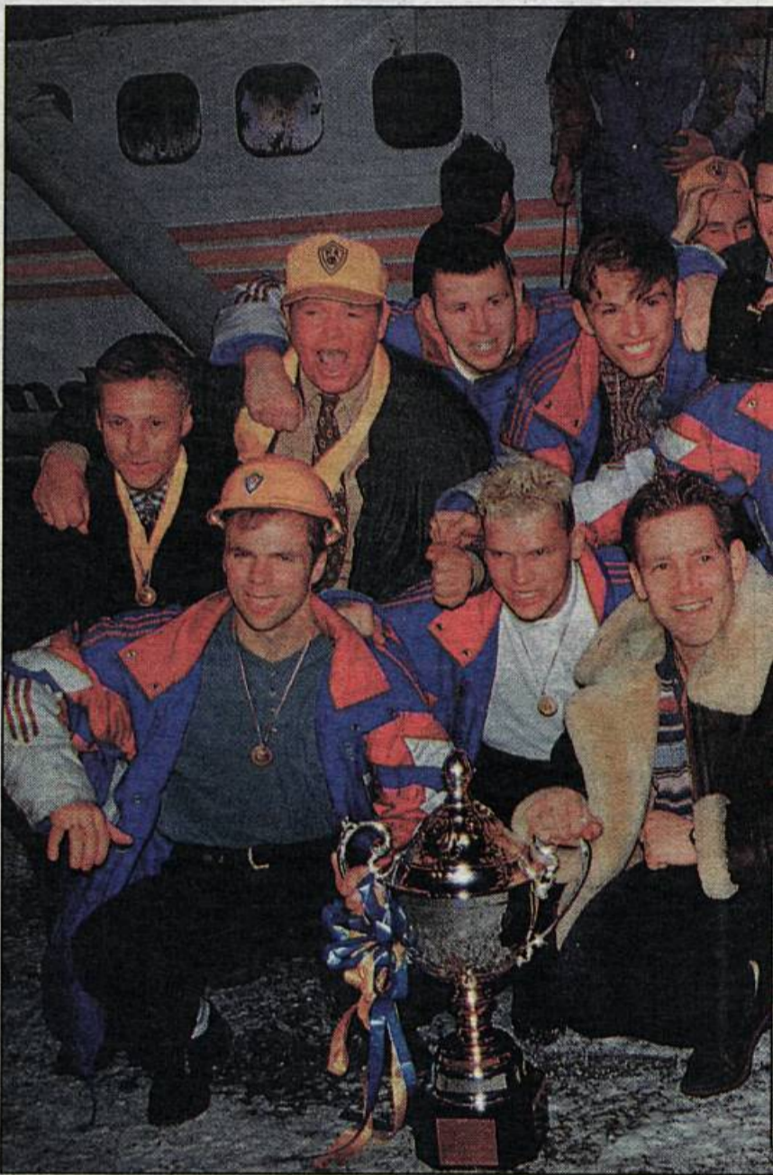
● Glaðir KA-menn á Akureyrarflugvelli komnir heim með bikarinn.

Óhætt er þó að segja að KA-menn hafi farið lengri leiðina í því að vinna sigur í bikarkeppninni. Þeir héldu áhangendum sínum standandi á öndinni í tvígang, í fyrria skiptið þegar leikurinn var úti eftir venjulegum leiktíma og eins þegar úrslitin virtust ráðin tæpum tveimur mínútum fyrir lok fyrri framlengingar en þá voru KA-menn þremur mörkum yfir. Það var