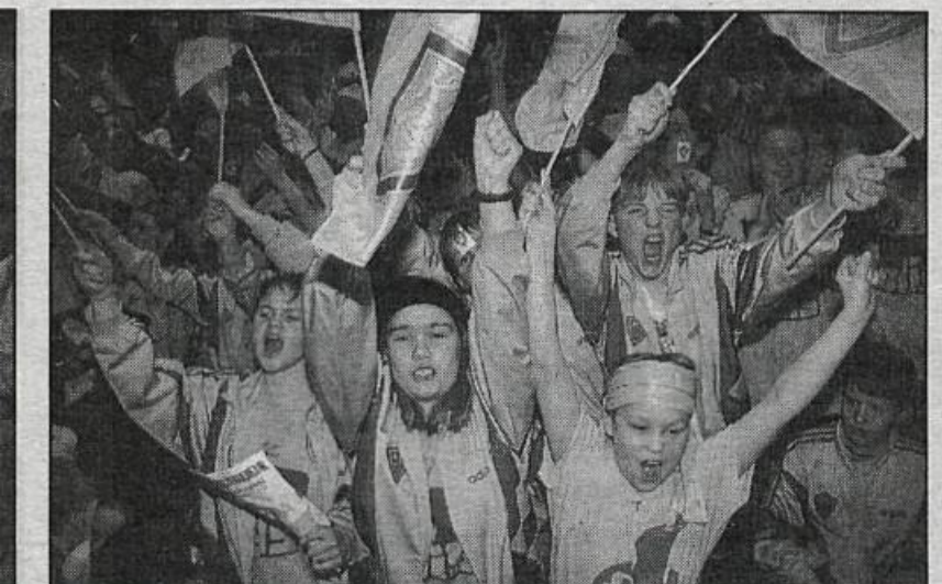
● Stuðningsmenn KA fjölmenntu í Laugardalshöllina og hafa örugglega ekki séð eftir aurunum sem í það fóru. Hér sjást stuðningsmennirnir fagna sigri KA.